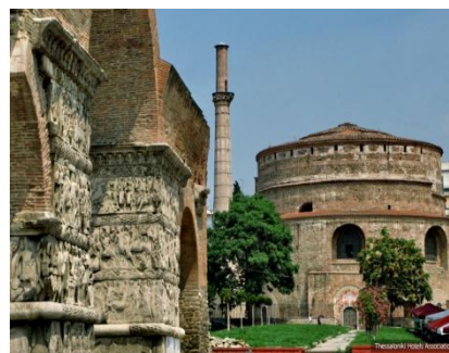
Арка и гробница Галерия

4 день (03.05.2015) Завтрак, отдых на пляжах лазурного Средиземного моря.