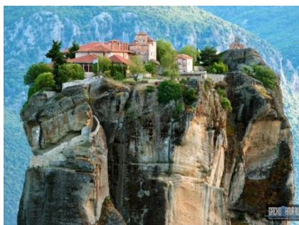
Знаменитые монастыри - Метеоры

6 день (07.05.2015) – Завтрак, обзорная экскурсия по Старинному Городу «Велико-Тырново». В данном городе можно запросто попасть в 12 или 13 век. Вроде бы шел по современной улице — как тут же оказался в далеком прошлом. Старый город — это сердце Велико-Тырново. Здесь на небольшом пятчке собраны архитектурные памятники Болгарии. Например, турецкий конак, неподалеку расположены церковь Константина и Елены, а также святых Кирилла и Мефодия. Туристов зазывают ремесленные мастерские. Постоялый двор Хаджи Никола очень похож на константинопольский караван-сарай. Рядом с ним стоит Домик с обезьянкой — здание с выразительной фигуркой под эркером. Большое впечатление производит на гостей города улица Гурко — здесь множество отреставрированных построек, лавочки, рестораны, гостиницы. В общем, атмосфера 18-19 веков передана идеально. Следует выезд в Кишинеv.