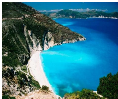
Лазурный берег - Греция

7 день (06.05.2015) – Завтрак в отеле, освобождение номеров, отправление к могучим отвесным скалам (Метеорам), на самых вершинах которых величественно «парят» поднебесные монастыри. Отправление в Велико-Тырново, ночлег.