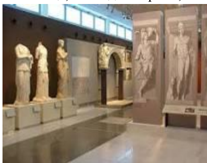
Музей византийской культуры

Выезд в Касторью –шопинг за шубами! Если вы еще ни разу не бывали в Касторье, представьте себе потрясающе красивый и спокойный городок с пьянящим горным воздухом, тихими улочками и огромным количеством старинных церквушек. Следует выезд в Афины, приезд и размещение в гостинице, свободное время, ночлег.